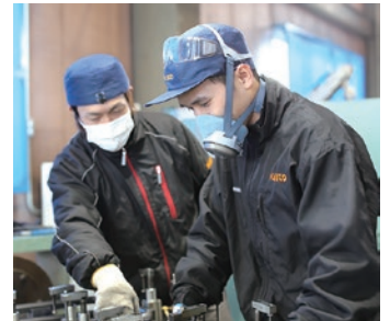
就職先で指導を受ける外国人留学生