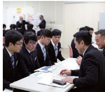
大盛況だった前回開催時の様子

〒190-0012 東京都立川市曙町2-38-5 立川ビジネスセンタービル12F