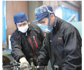
就職先で指導を受ける外国人留学生